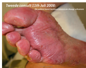
Foto 3. Ondanks voortzetting Capecitabine

Tweede consult na vier weken (zie foto 3)