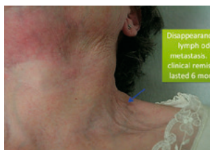
Foto 5. Remissie van de metastase gedurende zes maanden met capecitabine